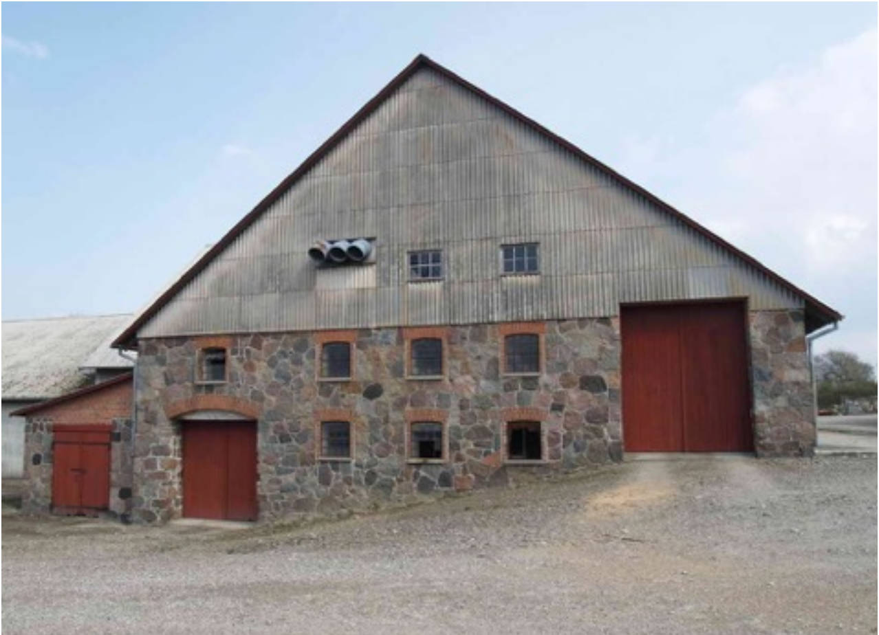
I enden af den store lade fra 1876 er der magasin med indkørsel i flere etager.