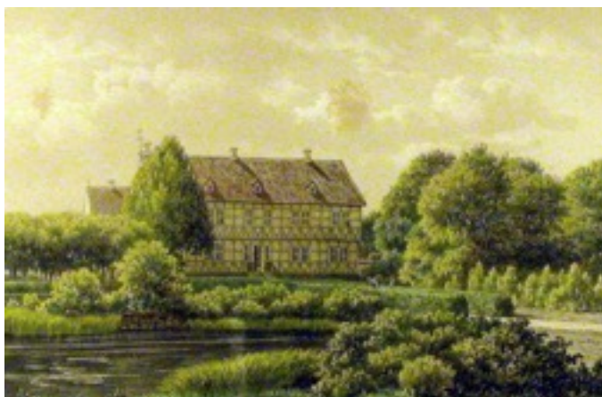
Den gamle hovedbygning.