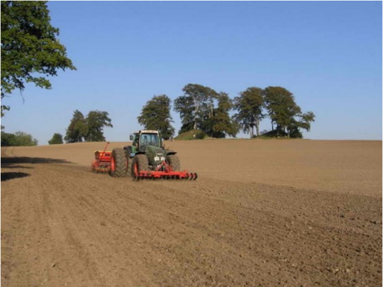
Ryegaard driver et stort landbrug. Udover godsets egne 623 ha forpagtes en del jord. Her sås hvede med Sakshøje i baggrunden.