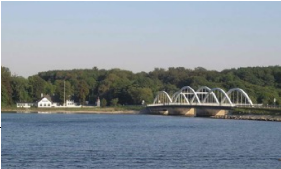
Munkholm broen med Lingtved Fægekro.