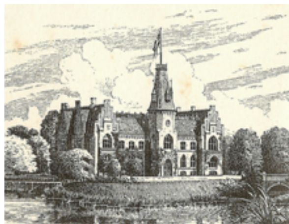
Den "nye" hovedbygning som kun står fra 1878 til den rives ned 1974.