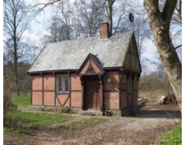
Galtebjergshus eller Ammens hus.