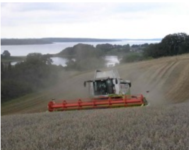
Hvede med Bramsnæs i baggrunden.