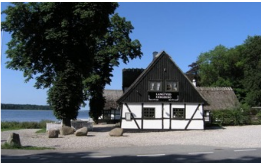
Lingtved Fægekro hører til Ryegaard..