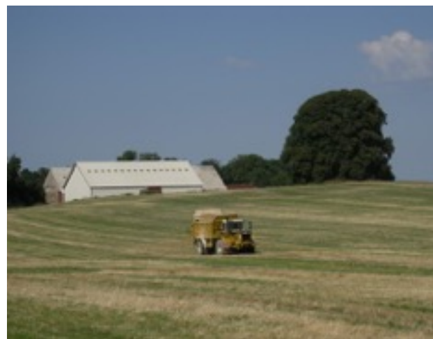
Der spredes kalk med avlsgården og Lysthøj i baggrunden.